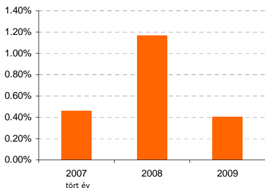
Concorde EURO Pénzpiaci és a referencia alakulása